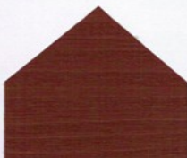
7115 Rotbraun* ■