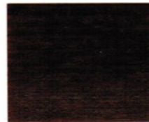
7810 Palisander ●