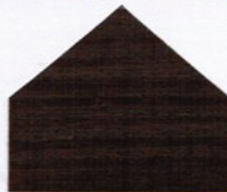
7086 Schokoladenbraun (RAL 8017) ●