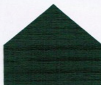
5172 Moosgrün (RAL 6005) ● ■