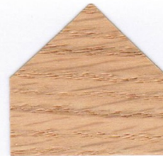
Eiche 3x mit GORI 79 FARBLOS AUSSEN behandelt