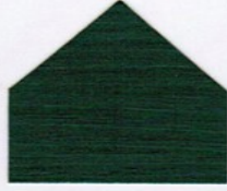
568 Moosgrün (RAL 6005)