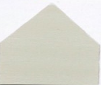
2052 Lichtgrau (RAL 7035) ●