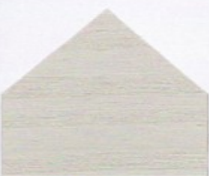
8074 Grau* ■