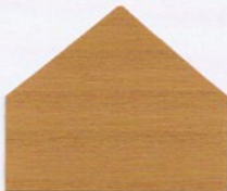
3165 Ocker* ● ■