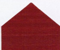
7117 Englischrot* ● ■