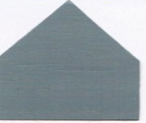
2053 Silbergrau (RAL 7001) ●