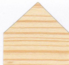
Kiefer 3x mit GORI 79 FARBLOS AUSSEN behandelt