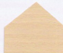
3166 Hellocker ■