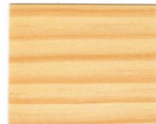
9900 Farblos* ■