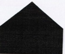
8099 Nachtschwarz ■