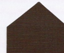
7116 Dunkelbraun* ■