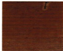
7808 Nussbaum ●