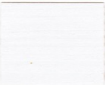
8855 Polarweiss/800 Weiss*