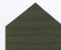
5173 Umbragrün* ■