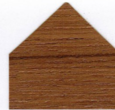
Teak 3x mit GORI 79 FARBLOS AUSSEN behandelt