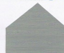
2073 Mittelgrau* ■