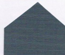
4167 Graublau* ■