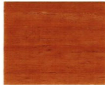
7802 Kiefer ●