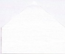
8855 Polarweiss ● ■