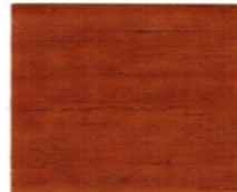
7804 Burma Teak ●