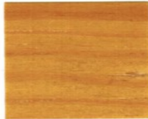
7801 Eiche Hell ●